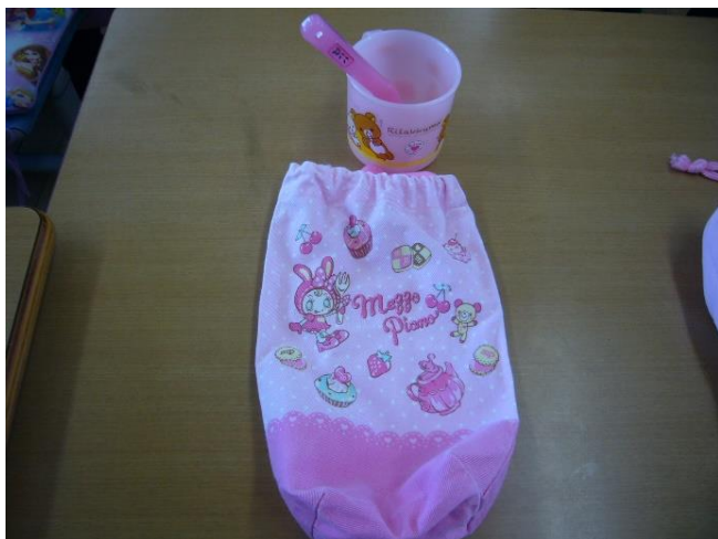
3 歯ブラシ・コップを入れる袋