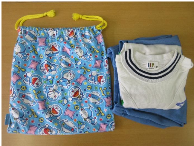
1 体操服を入れる袋