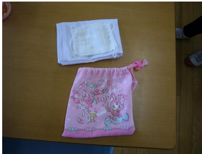
2 テーブルクロスを入れる袋